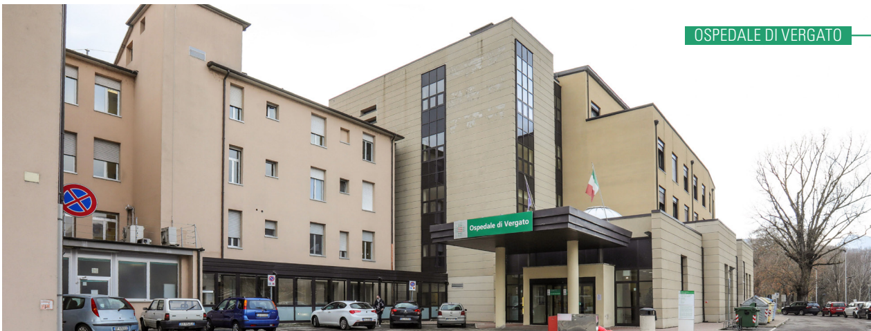
OSPEDALE DI VERGATO