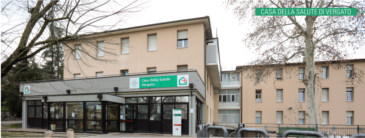
CASA DELLA SALUTE DI VERGATO