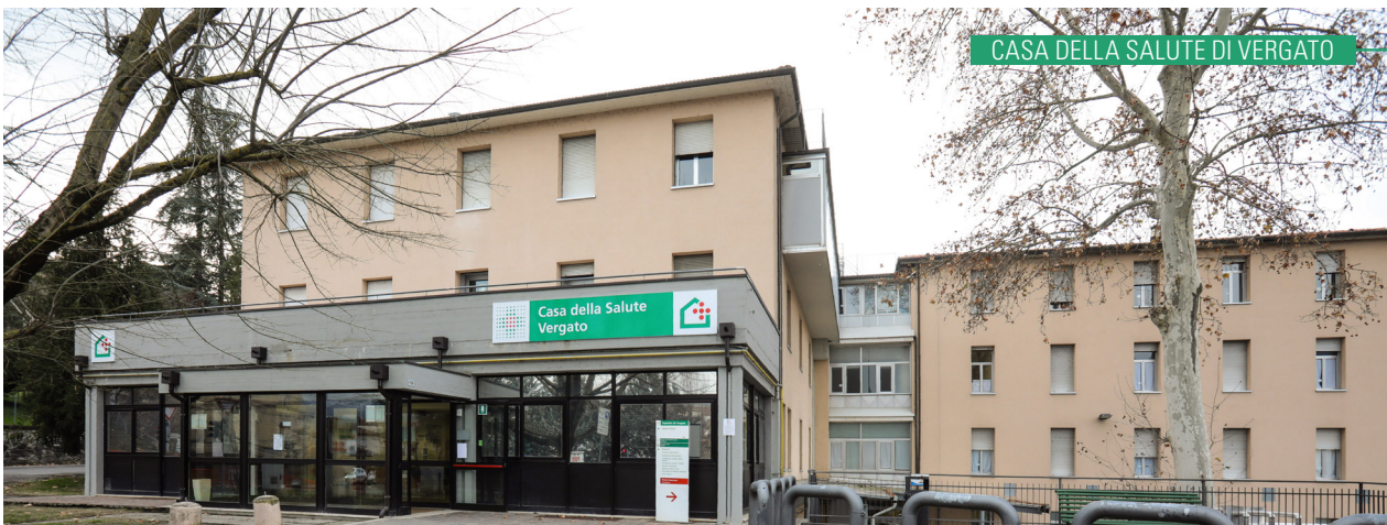
CASA DELLA SALUTE DI VERGATO