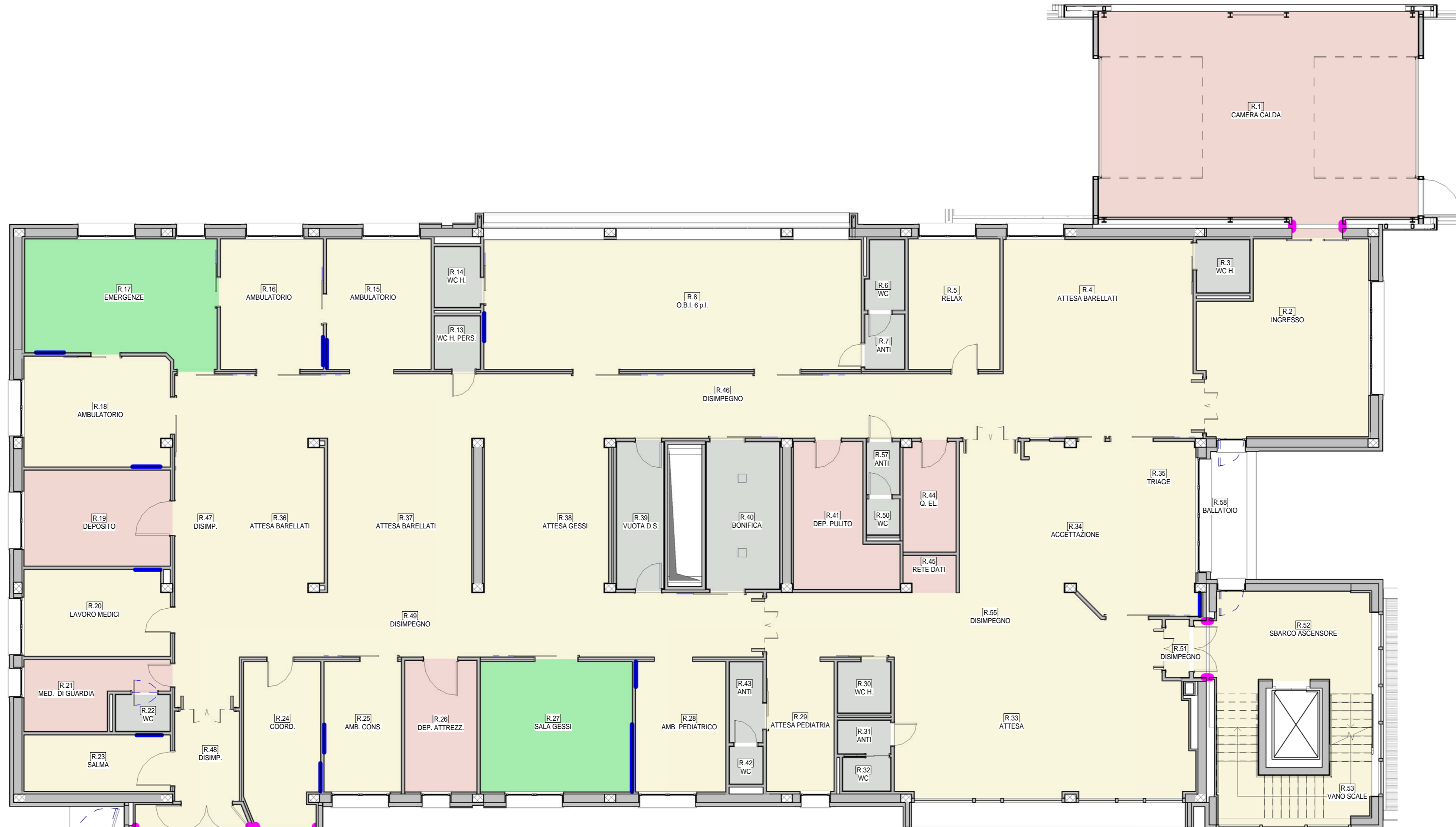
Piano Rialzato 1 : 100

NOTA BENE: Le zone non controsoffitate o in vista dovranno essere tinteggiate con idropittura lavabile.