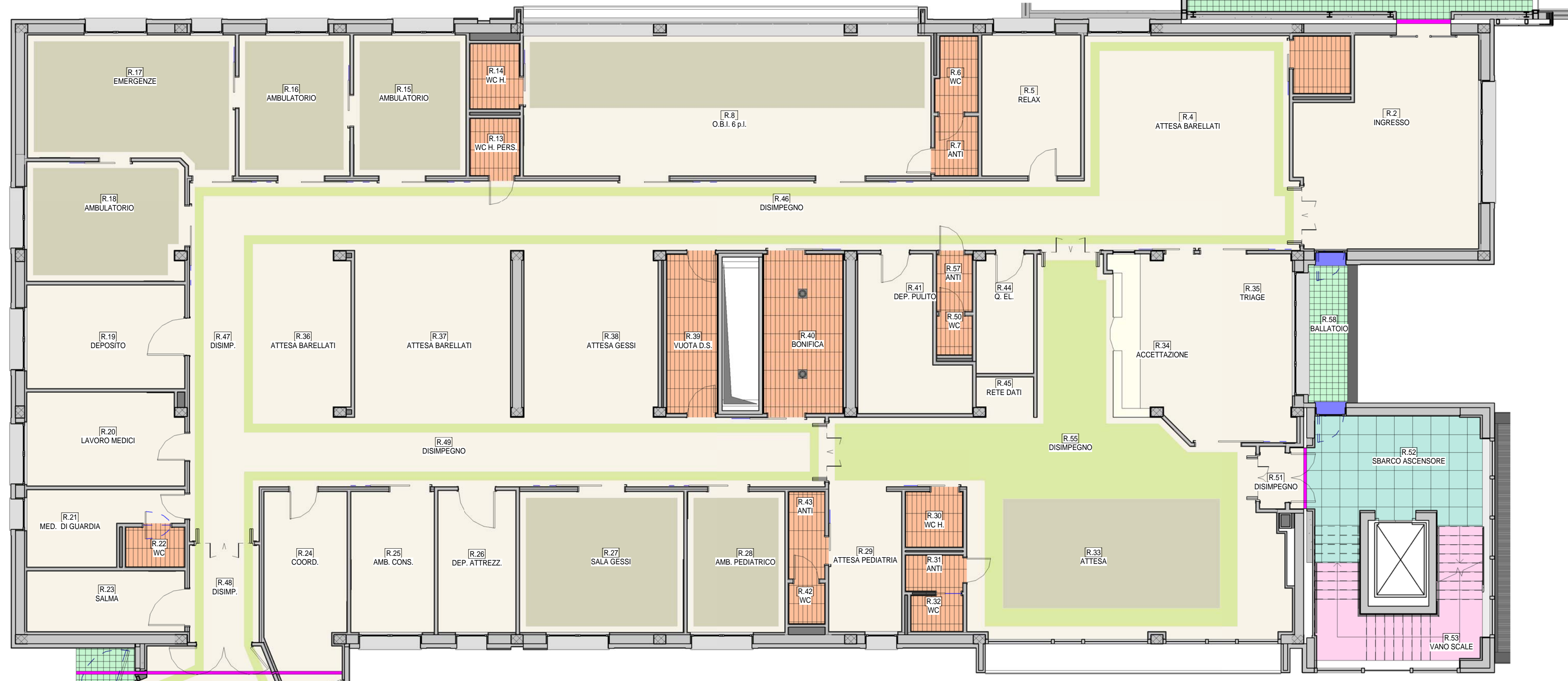
Piano Rialzato 1 : 100