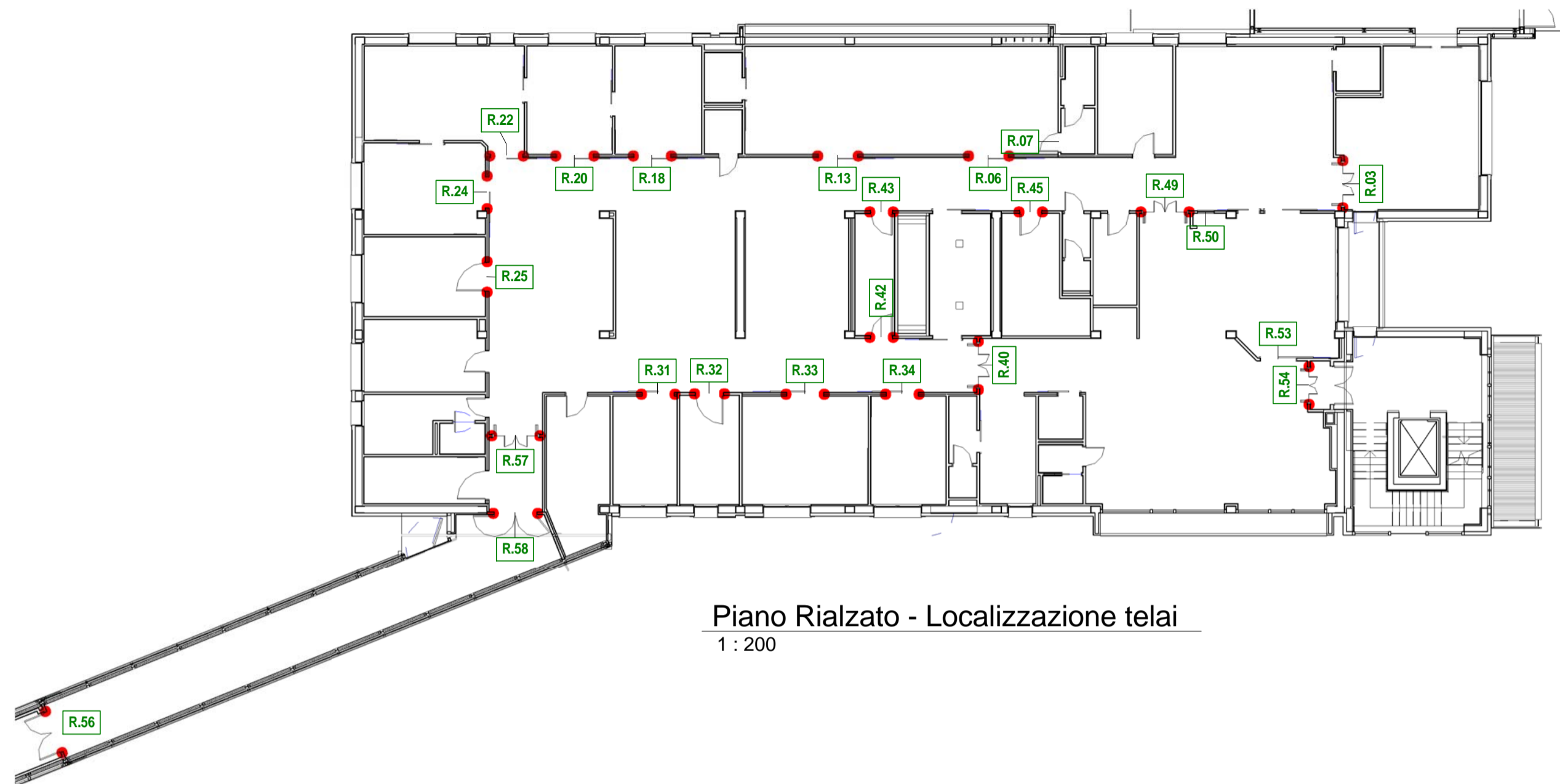
Piano Rialzato - Localizzazione telai 1 : 200