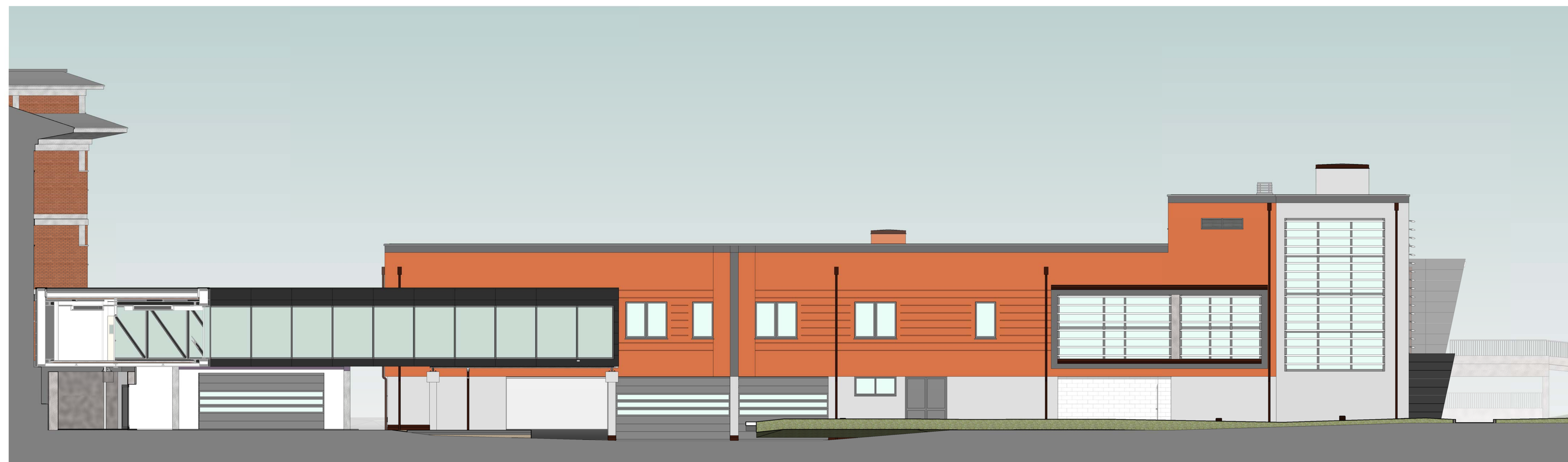
Sud-est 1 : 100