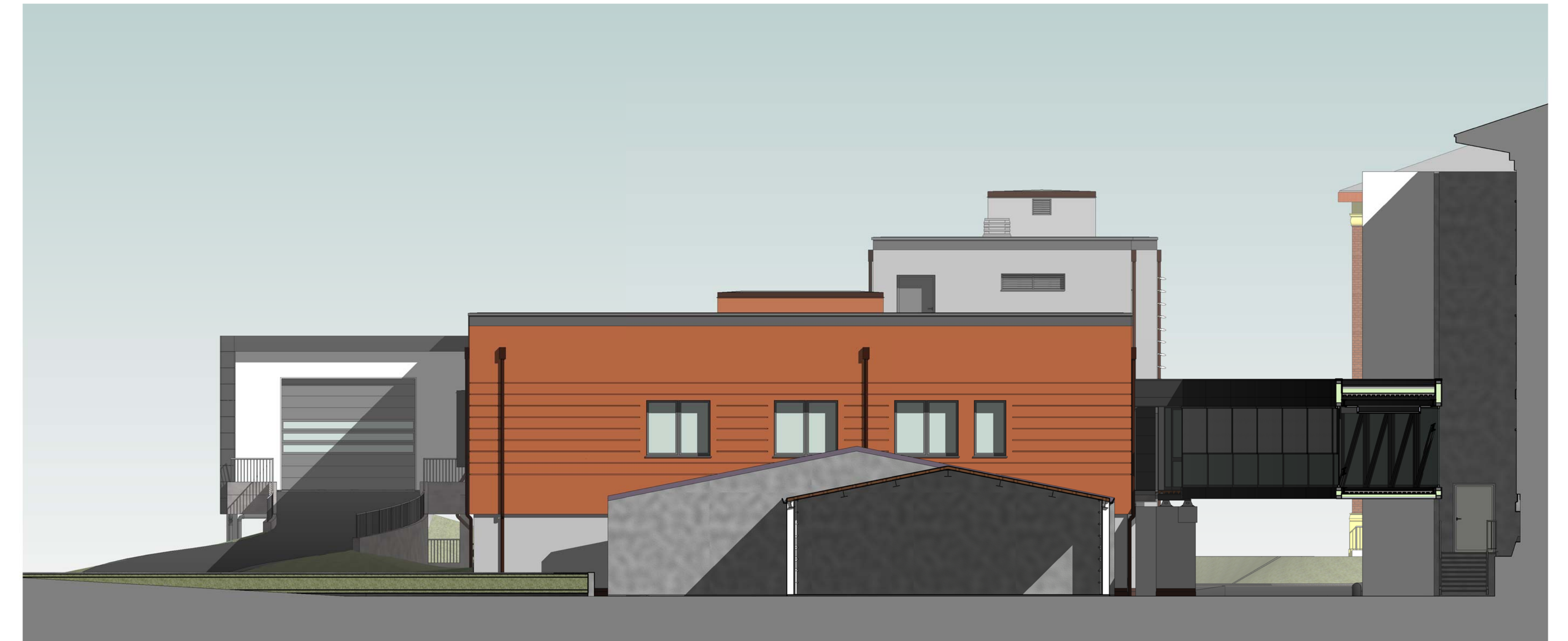
Sud-ovest 1 : 100