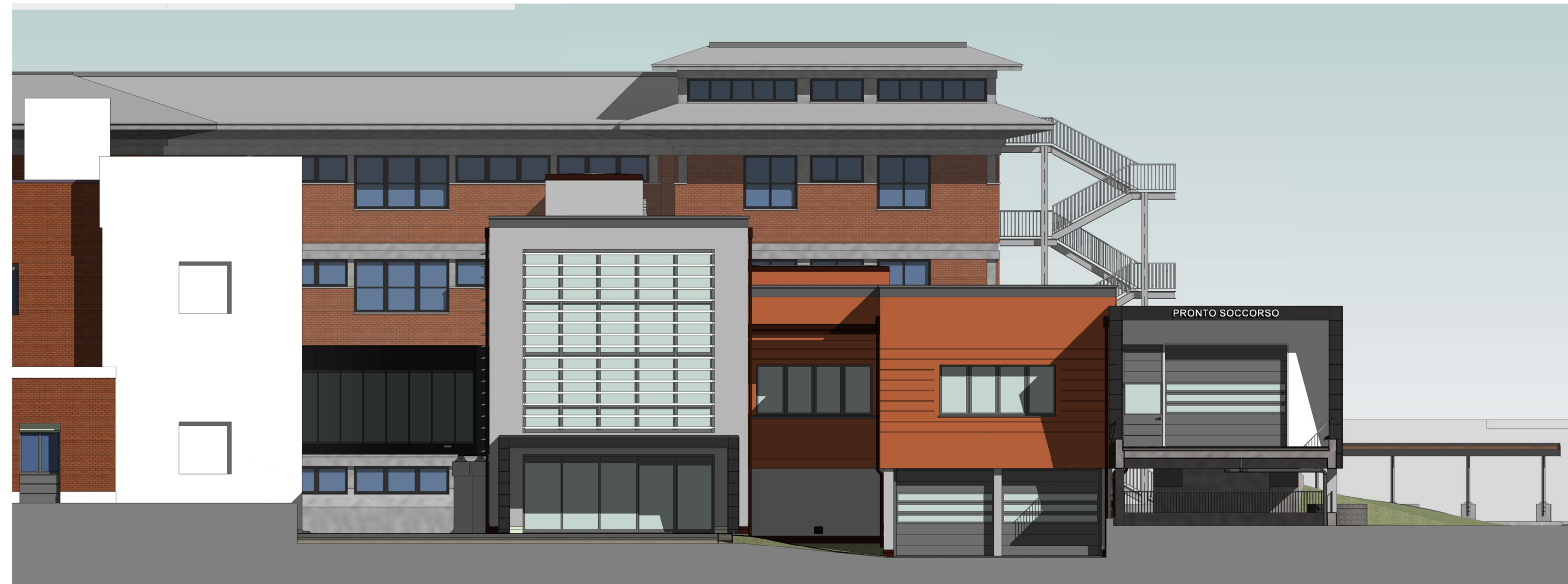
PROSPETTO NORD 1 : 100