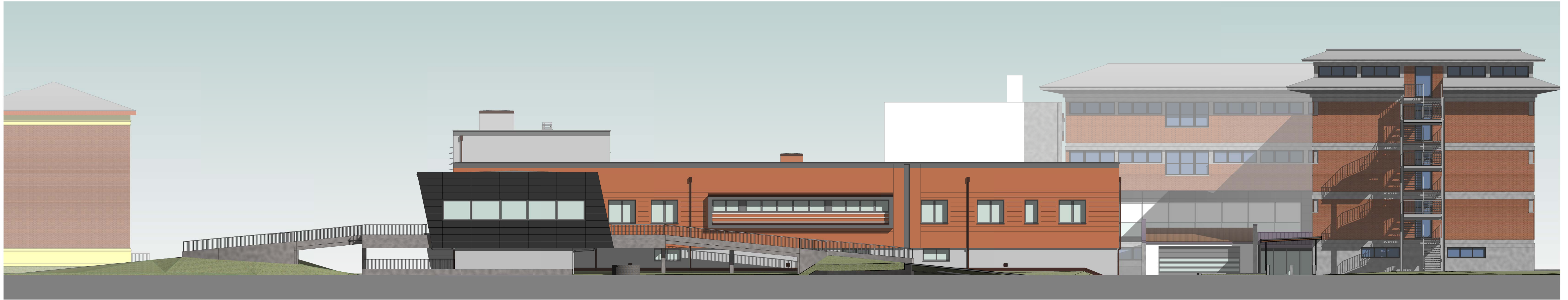
Nord-Ovest 1 : 100