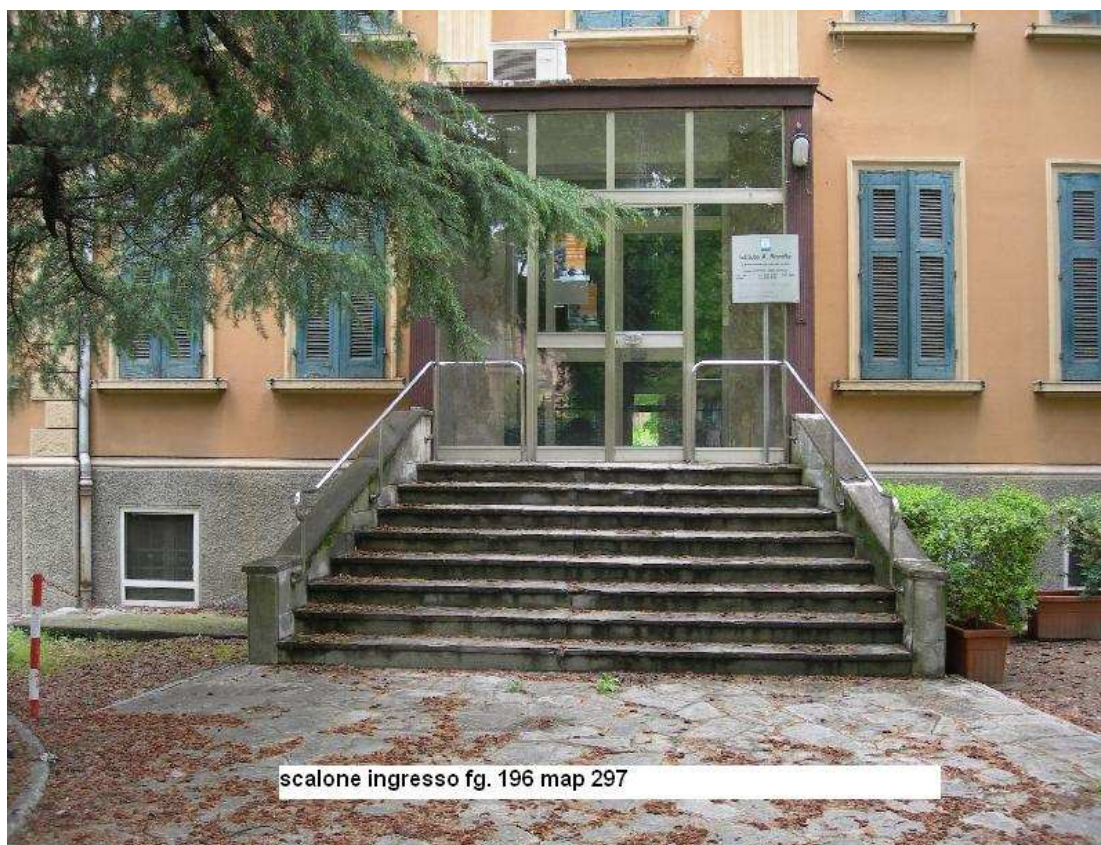
scalone ingresso fg. 196 map 297