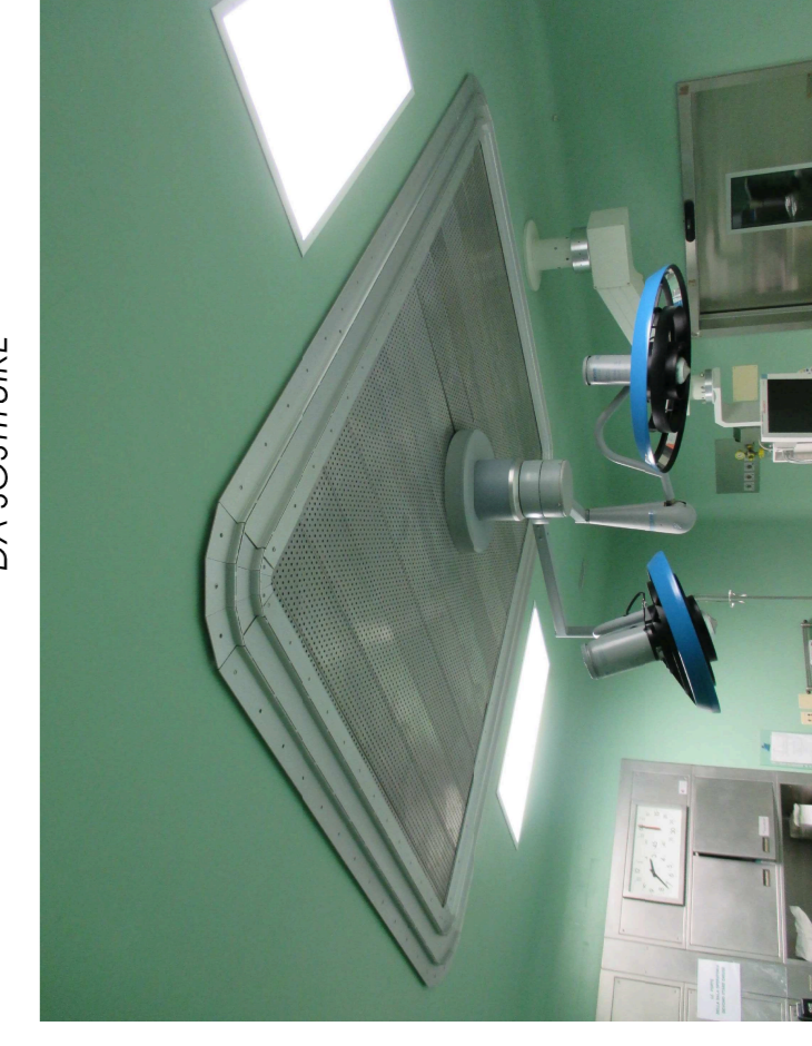
ESEMPIO DI LAMPADA SCALITICA DA SOSTITUIRE