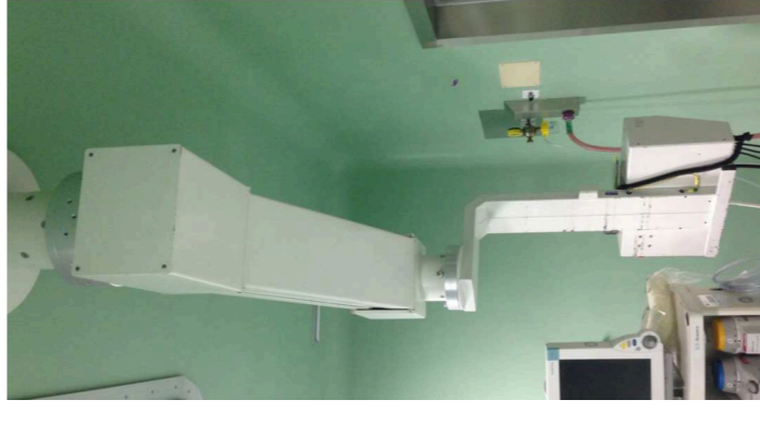
ESEMPIO DI PENSILE DA SOSTITUIRE