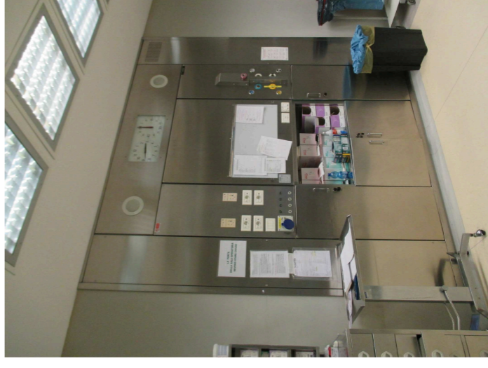
ESEMPIO DI PARETE ATTREZZATA DA SOSTITUIRE