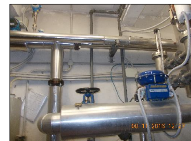
⑦ Tubazioni vapore/condensa da smantellare. E' previsto il recupero delle apparecchiature segnalate dalla DL. Rif EPU F1.1.80 - F1.1.130