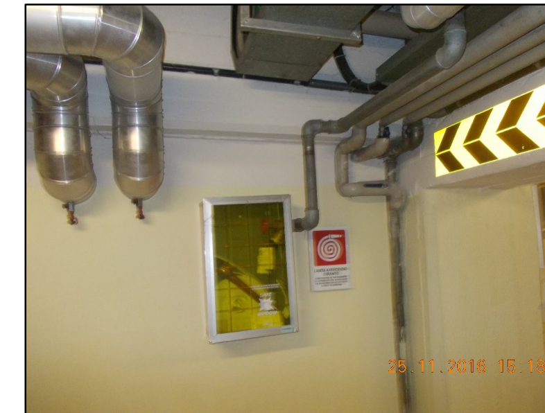
⑨ Spostamento cassetta UNI Rif EPU NP.M.04