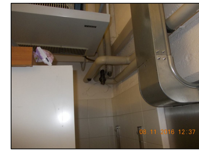
⑩ Smanellamento tubazioni a servizio locali sterilizzazione, mantenimento montanti ai piani superiori Rif EPU F1.1.80 - F1.1.130