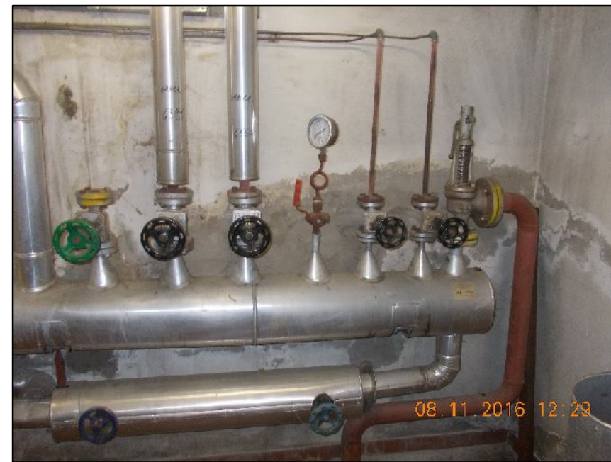
④ Collettore di distribuzione vapore da smantellare unitamente a tutte le apparecchiature e tubazioni che vi sono collegate. N.B. le flange contrassegnate con il colore giallo, contengono guarnizioni in amianto, che dovranno essere smaltite secondo le disposizioni di legge vigenti in materia. Rif EPU NP.M.03