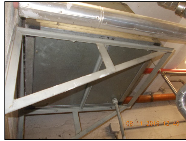
③ Estrattore aria a soffitto da smantellare unitamente alle canalizzazioni collegate Rif EPU F1.1.20.b