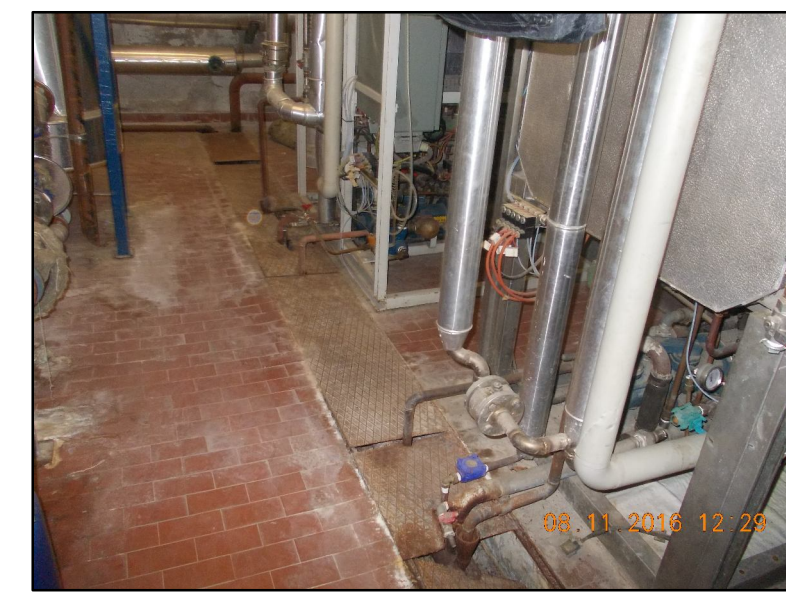
⑥ Smanellamento tubazioni in cunicolo ispezionabile EPU F1.1.80