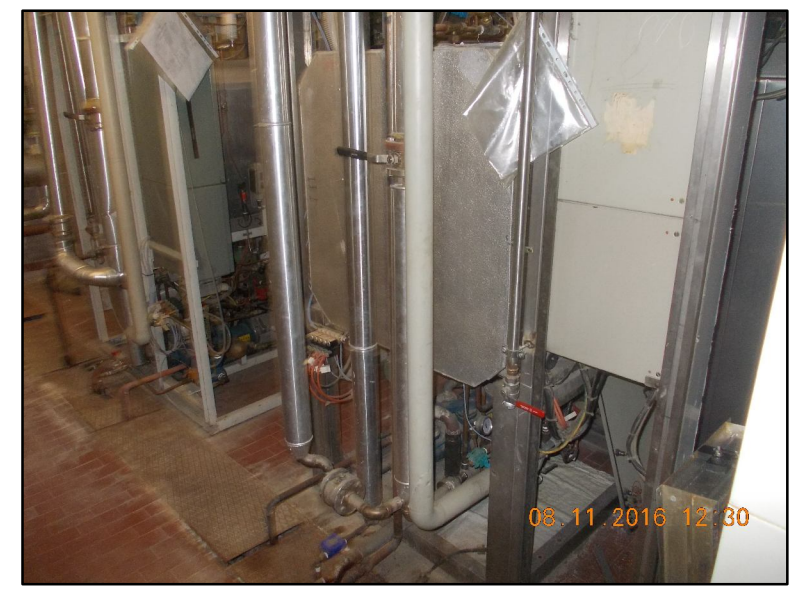
② Sterilizzatrici da smantellare unitamente a tutti i suoi collegamenti idraulici esistenti Rif EPU NP.M.02