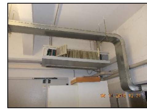
⑤ Ventilconvettore a soffitto da smantellare compreso sezionamento tubazioni di collegamento. Rif EPU F1.1.210