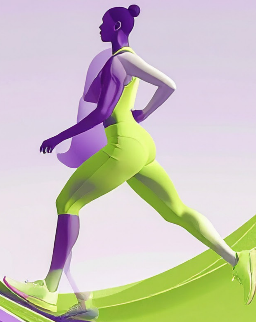
Immagine: generata con IA

LE INIZIATIVE GRATUITE DELL'AZIENDA USL DI BOLOGNA E DEL POLICLINICO DI SANT'ORSOLA