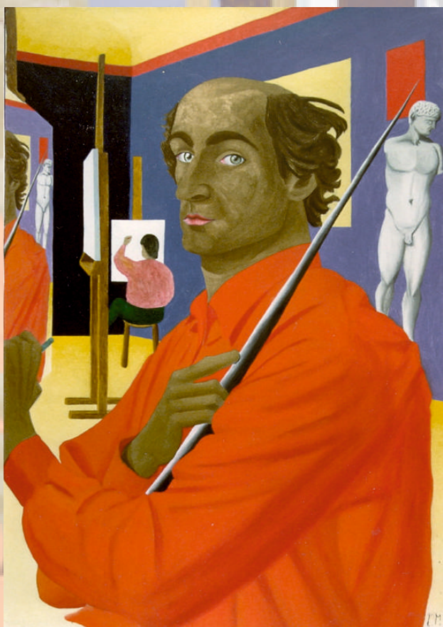
Mela - Autoritratto calvo