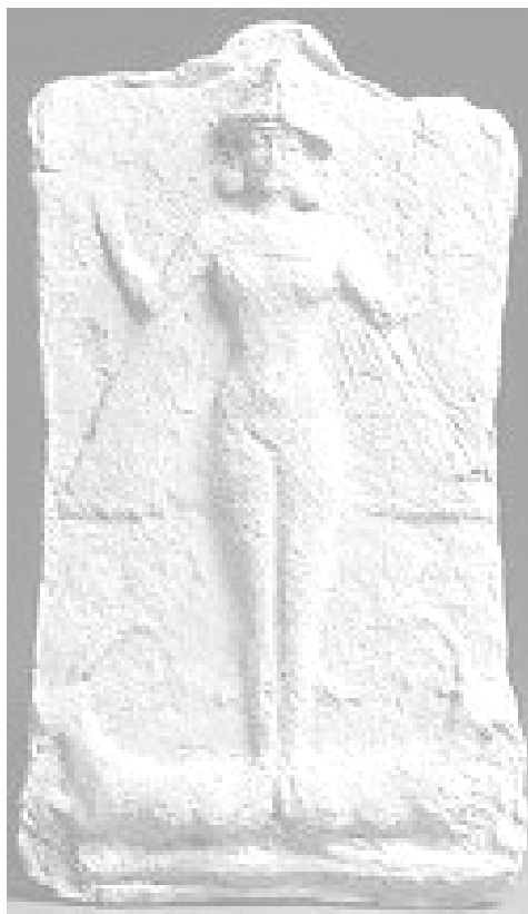
Immagine: Istar, "Signora della Luce Risplendente", Dea Mesopotamia