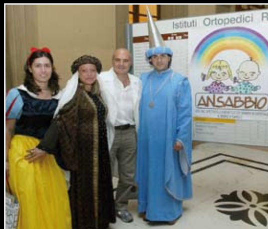
L'attore Luca Zingaretti, in arte "Commissario Montalbano", Dottore del Sorriso (nella foto con Dario Cirrone e i volontari dell'ANSABBIO) tra le corsie dell'Ospedale Rizzoli. (7/7/2005).

Un riconoscimento di alto valore per un'iniziativa umanitaria importante come ANSABBIO. Presenti per l'occasione anche il Direttore