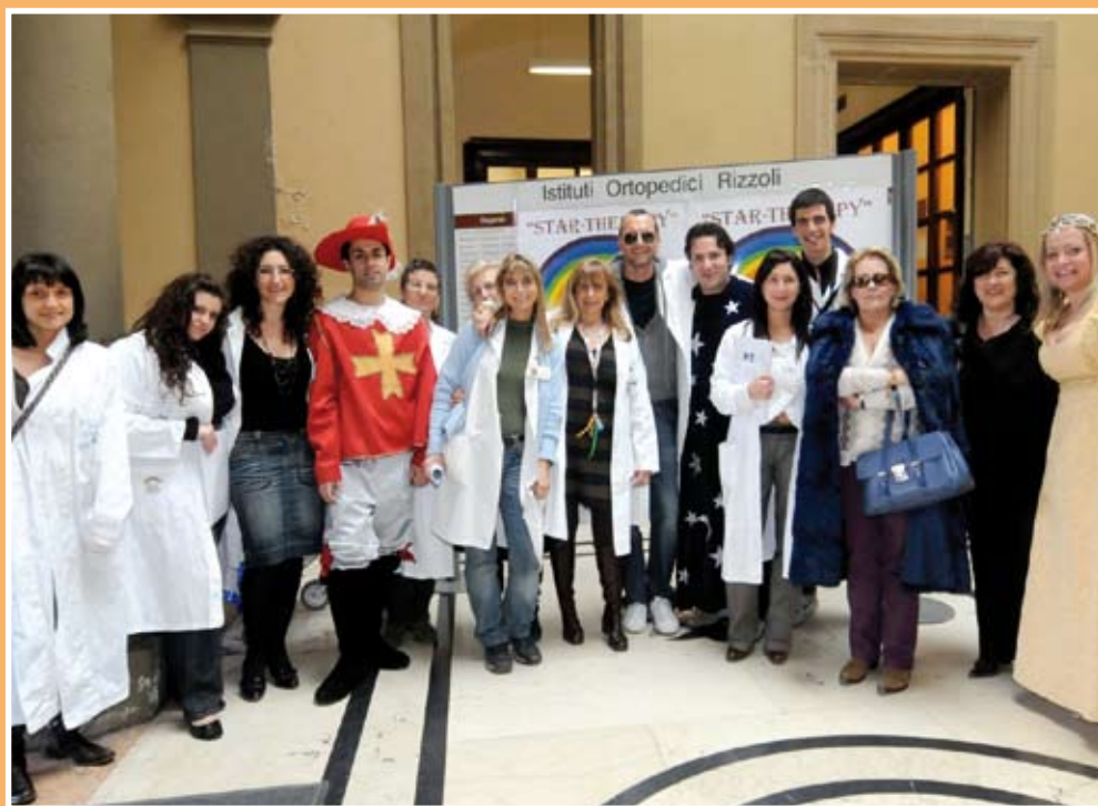
22 febbraio 2008 Nelle vesti di Dottore del Sorriso, il cantautore BIAGIO ANTONACCI, nella foto con gli Ansabbiootti.