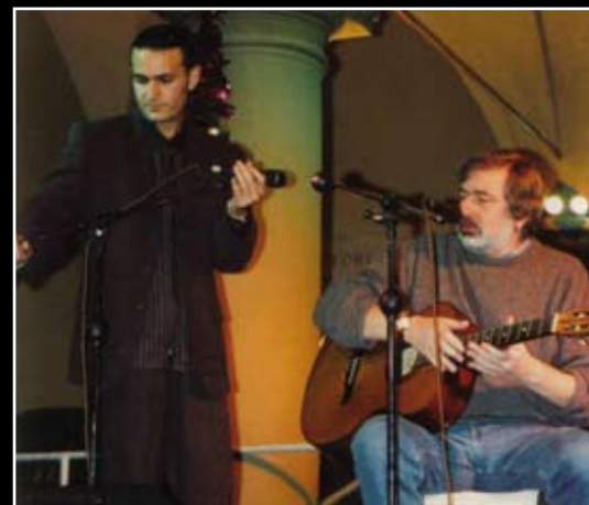
Il cantautore Francesco Guccini con il dottor Sorriso 3 dicembre 1994