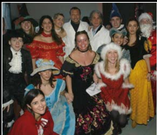
21/12/2003 Spettacolo di Natale a favore dei bambini ospedalizzati con i testimonial Biagio Antonacci e Riccardo Fogli, insieme agli operatori socio sanitari ed i volontari ANSABBIO

Dopo tanti dottori finalmente i corridoi dell'Istituto Ortopedico Rizzoli si tingono di rosa. La prima Dottoressa del Sorriso è