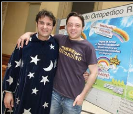
9 maggio 2009 Nelle vesti di Dottore del Sorriso, il cantautore Tiziano Ferro nella foto con Dario Cirrone.

Gran Gala di beneficenza, 6° edizione. Altroché Oscar hollywoodiani, le celebrità dello spettacolo, dello sport e del giornalismo si mobilitano soprattutto per ANSABBIO. Sul red carpet del Savoia Hotel