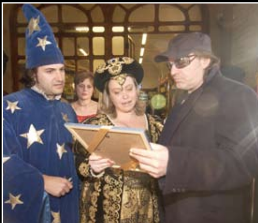
16 marzo 2005 Nelle vesti di Dottor del Sorriso puntuale come ogni anno il cantautore Vasco Rossi ormai noto come Primario del Sorriso , nella foto con Angela e il Dottor Sorriso Dario Cirrone.