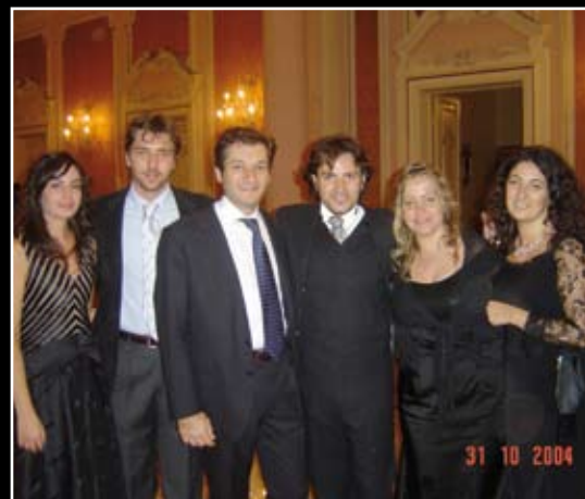
31 ottobre 2004 1° Gran Gala di beneficenza ANSABBIO nella foto giovani dottori e volontari.