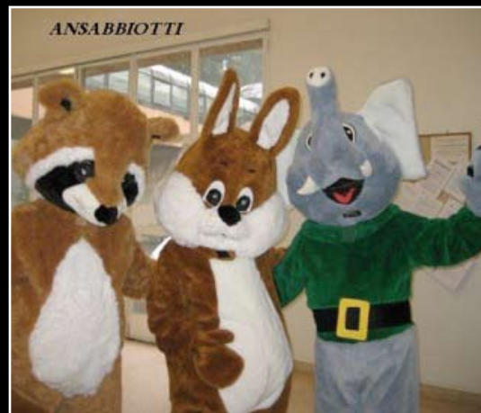
21 settembre 2008 Gli Ansabbiootti (nella foto) e i Dottori del Sorriso in visita per i piccoli ospedalizzati, per dare continuità alla "Star-therapy".