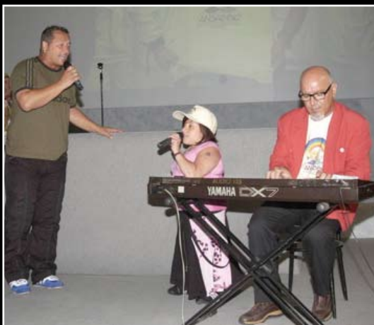
26 giugno 2004 Allo spettacolo "Canti, Balli, Magie e...il Sogno di Dario C" il cantante Paolo Belli, la soprano Chiara Internullo accompagnata dal Maestro Rocco Mammano.