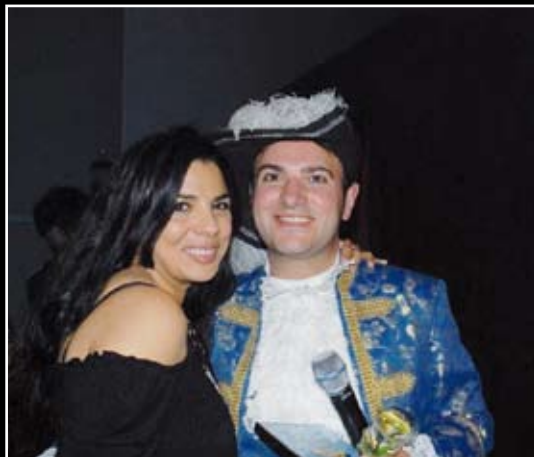
2 dicembre 2007 la cantante Mietta (nella foto con Dario C).